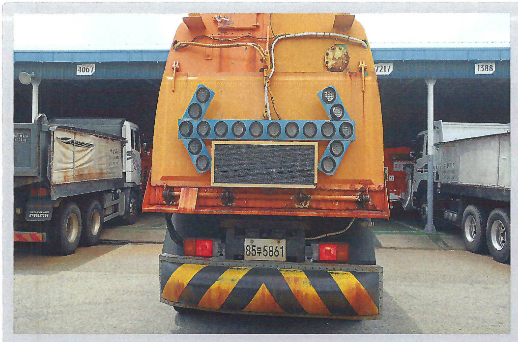
【 기호 1) 후면 전경 】