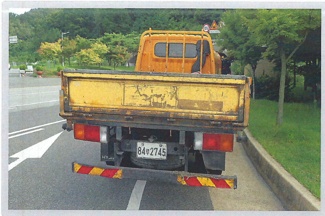
【 기호 2) 후면 전경 】