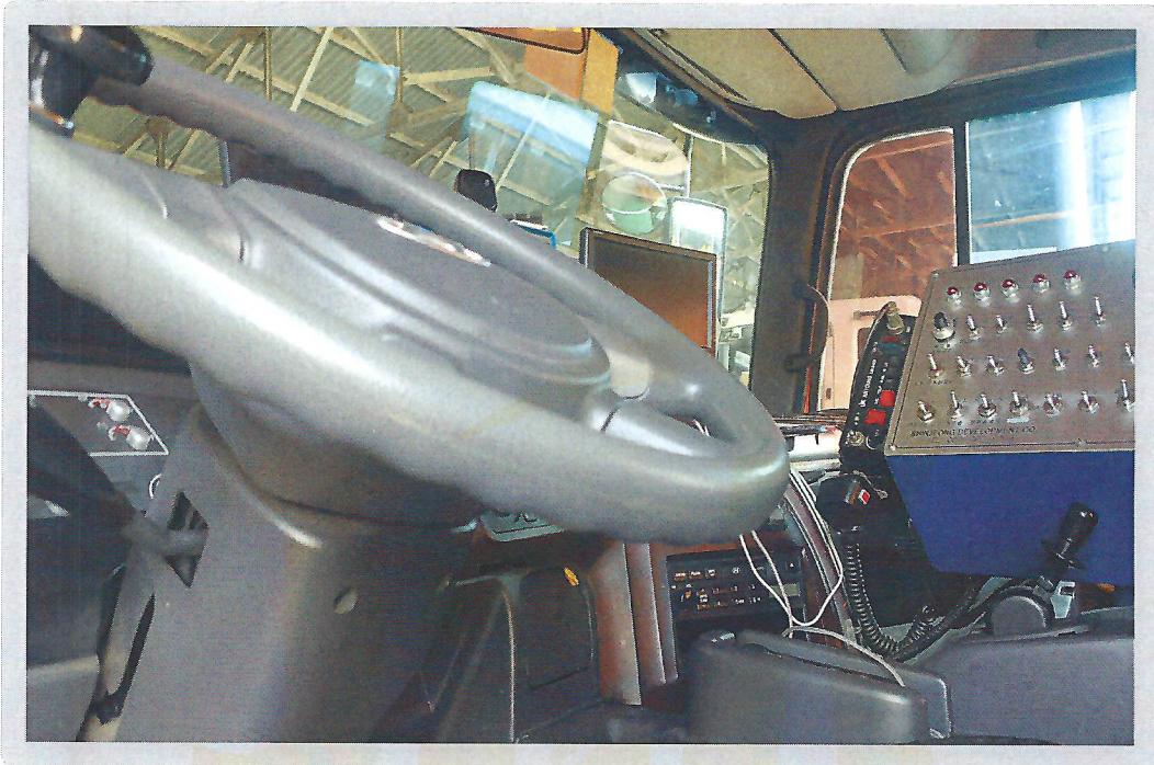
【 기호 1) 내부 】