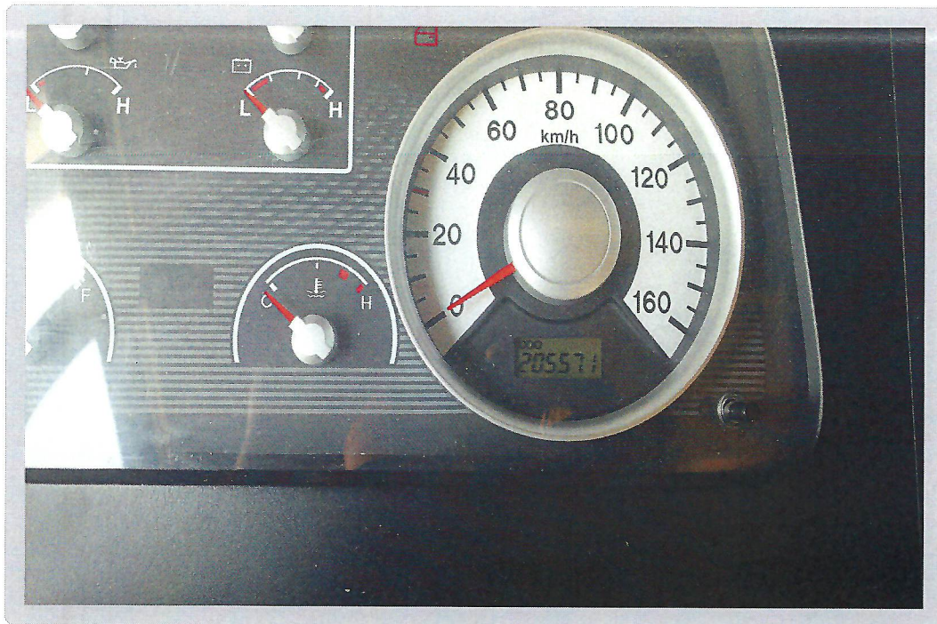
【 기호 1) 계기판 현황 】