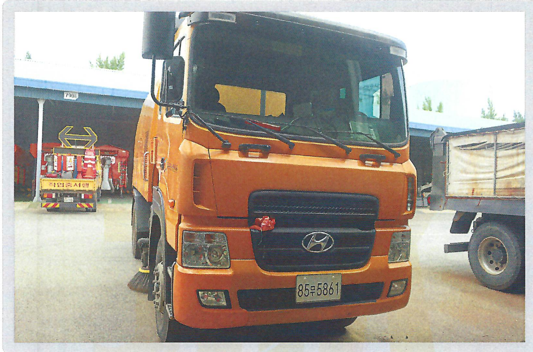
【 기호 1) 전면 전경 】