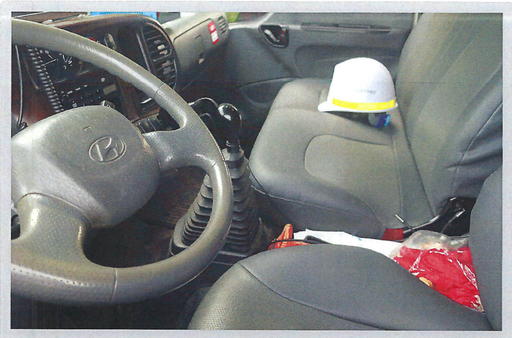
【 기호 2) 내부 】