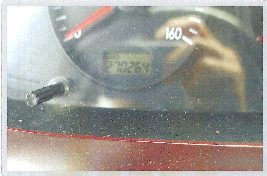
【 기호 1) 계기판 현황 】