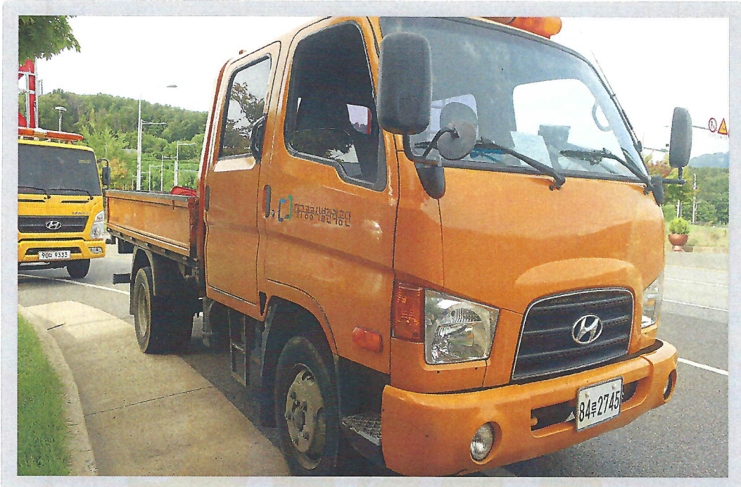
【 기호 2) 측면 전경 】