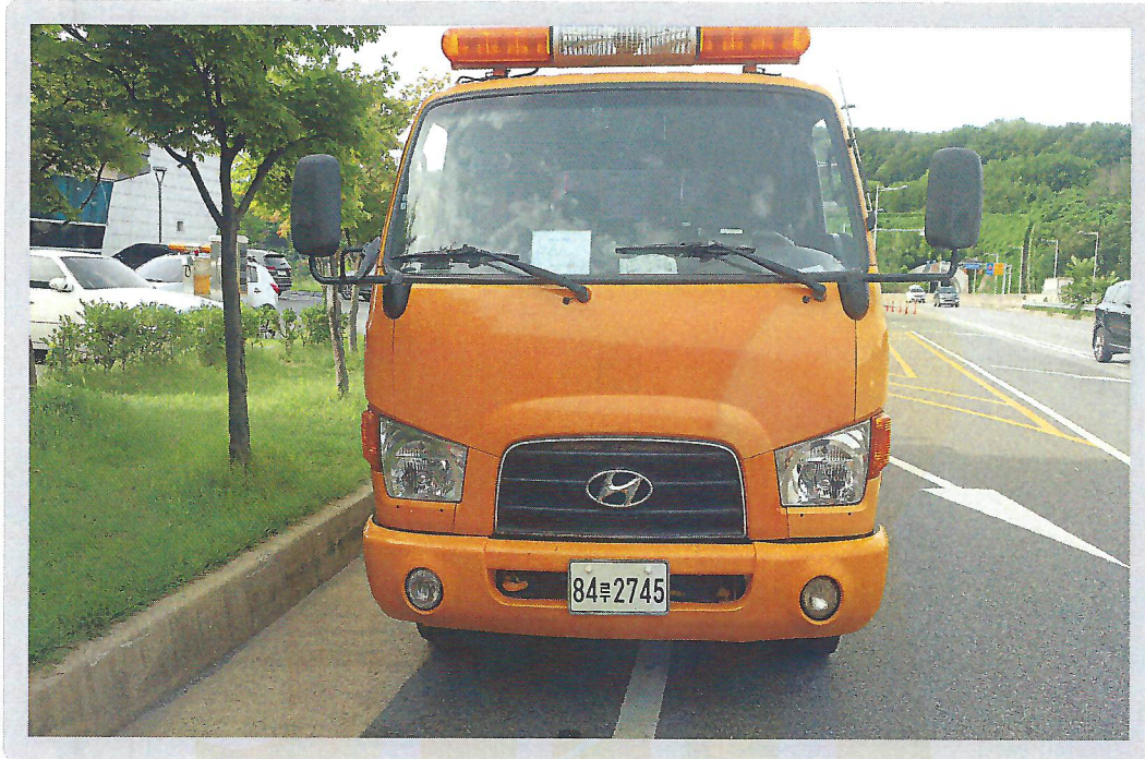
【 기호 2) 전면 전경 】