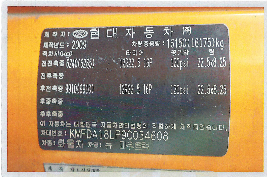
【 기호 1) 제원표 현황 】