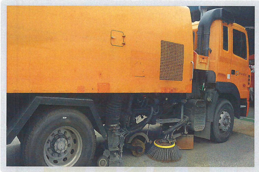
【 기호 1) 측면 전경 】