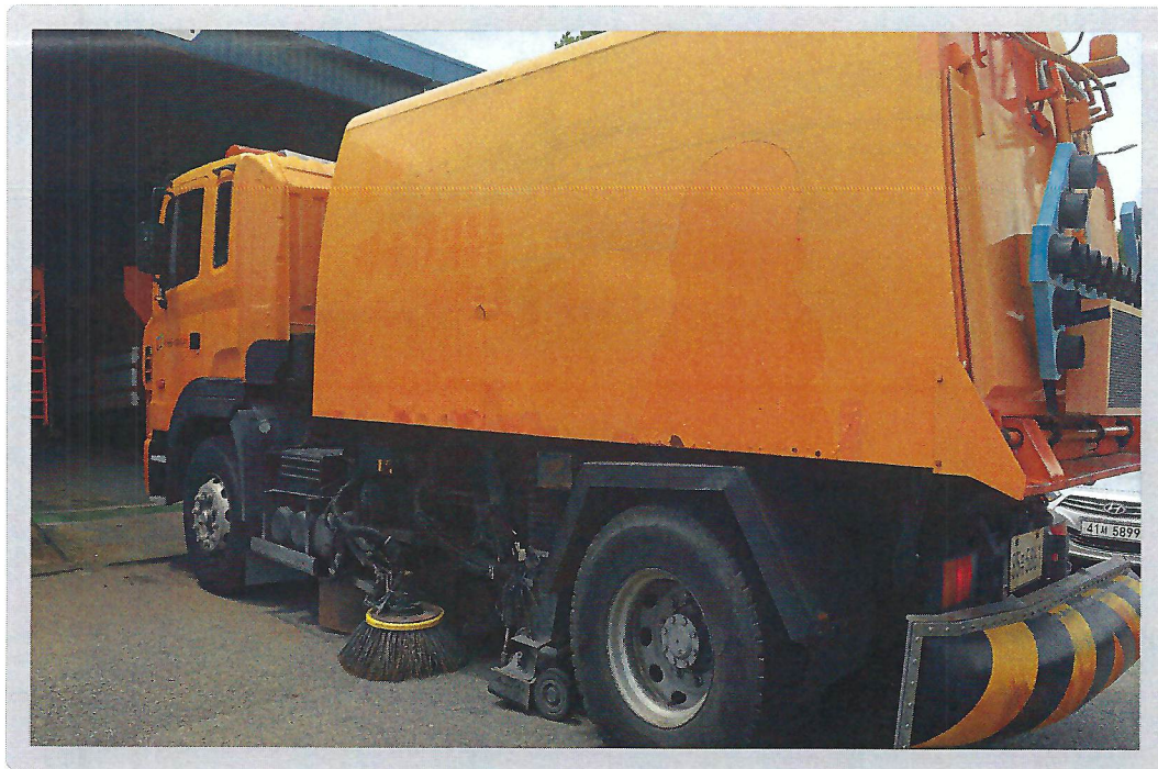
【 기호 1) 측면 전경 】